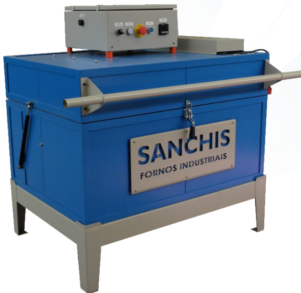
MODELOS: Avv - Bvv - Ccc