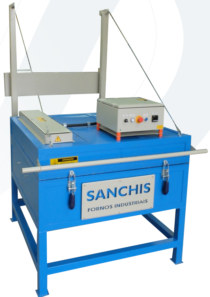
MODELOS: Dvv - Evv